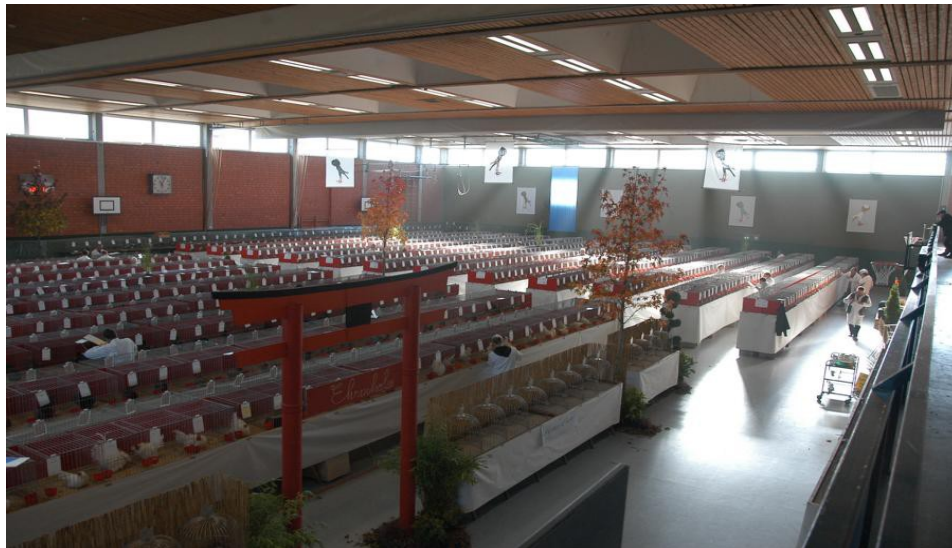
Gemeinsame Schau mit den Chabozüchtern