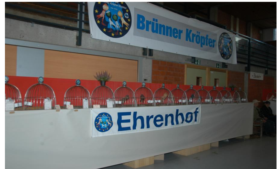
...der Ehrenhof, für die Präsentation der 'V-Tiere'