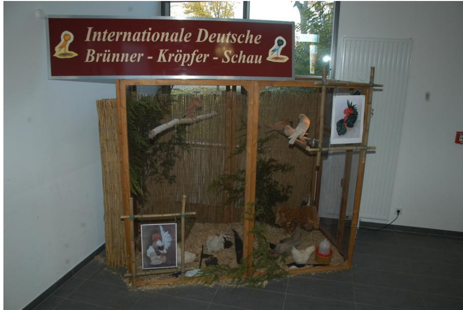
Im Foyer der Ausstellungshalle