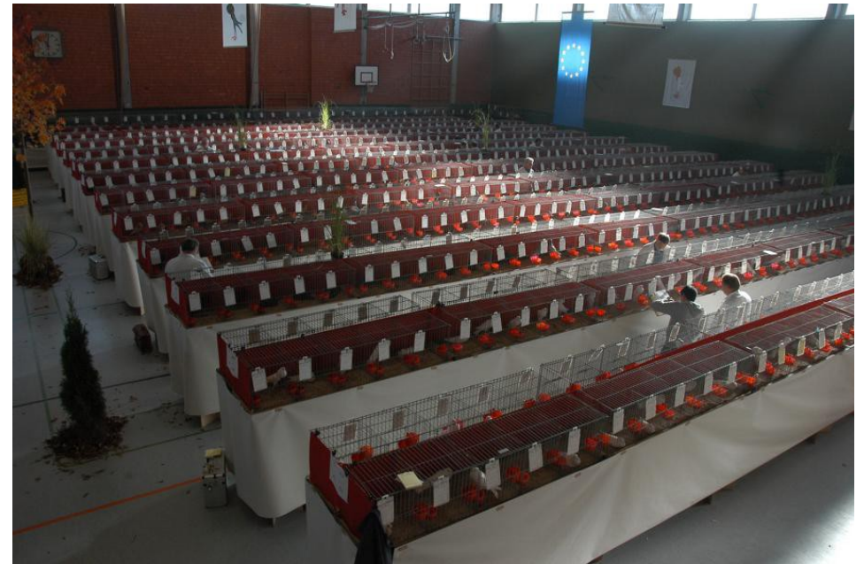
Blick in die wunderschön ausgeschmückte Mehrzweckhalle