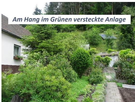
Am Hang im Grünen versteckte Anlage

Die Besitzerin des später gekauften Hauses hielt Hasen und Hühner und so kamen auch diese Haustiere noch dazu. Mitte der 60er Jahre vervollständigten dann noch diverse Fasanen-arten, wie Jagd-, Gold-, Silber und noch einige andere die Sammlung.