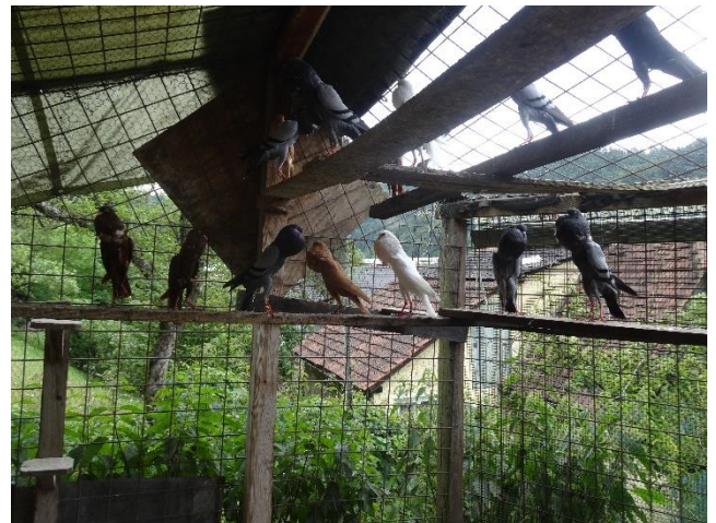
Erstklassige Brünnerkröpfer im Schlag

Er schloss sich bald dem Kleintierzuchtverein Kapfenberg an und erreichte bei den diversen Ausstellungen nicht nur lokale Siege - er wurde mit seinen Fasanen mehrfacher Landes- und Bundesmeister.