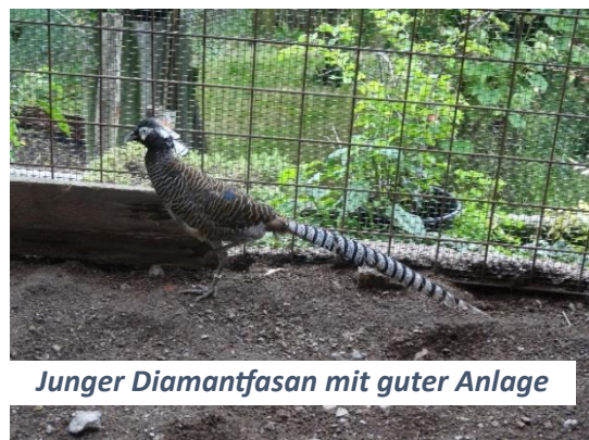
Junger Diamantfasan mit guter Anlage