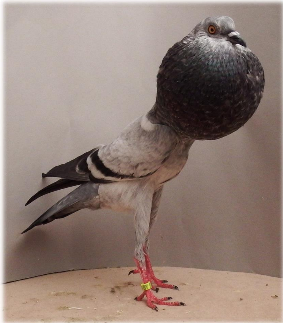
Eleganter und typischer Blau-Schimmel, noch Idee mehr Rieselung