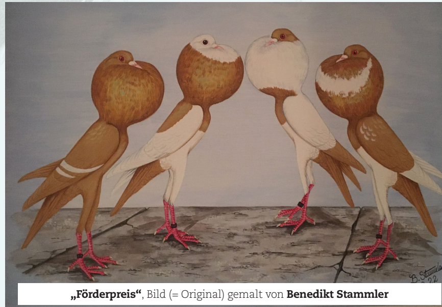
„Förderpreis“, Bild (= Original) gemalt von Benedikt Stammler